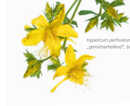
Hypericum perforatum, das Johanniskraut – eine „Allerweltheil“-Lichtpflanze „gemütshehellend“, blutstillend und wundheilend